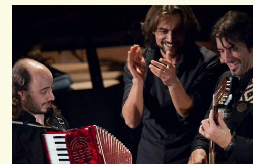
Del Barrio Trio

● Piazza Garibaldi, Galleria d'Arte A Casa di Paola ore 19.30 Fuori menù LABORATORIO CREATIVO PER BAMBINI (a numero chiuso) in collaborazione con la Galleria d'Arte A Casa di Paola. A seguire parata dei bambini con il cappello da cuoco da loro realizzato