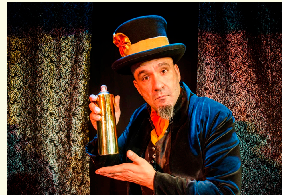
Visioni d'incanto - Terzostudio

● Torrione della Rocca ore 21.30, 22.15 e 23.00 Fuori menù ASSOLI DI DANZA (max 25 persone) a cura Gruppo Danza Forlimpopoli