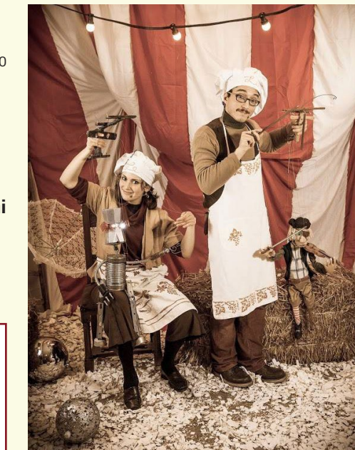
All'incirco - Storie cotte a puntino

L'Artusina, ricette per crescere felici COMPAGNIA LA FABIOLA Attenti qui due sorprensenti marionette a filo